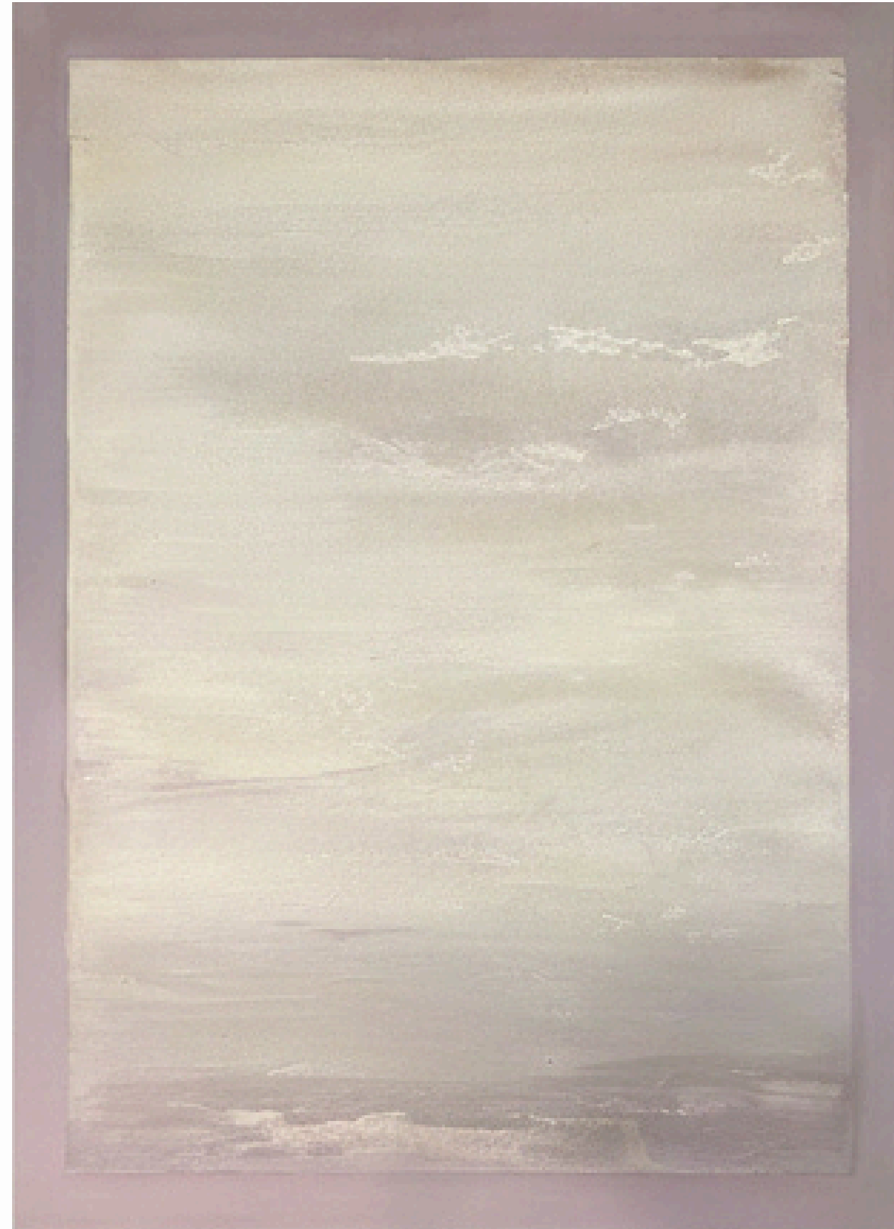
· Being · 2025, Natural Pigments and mediums on canvas 100 x 73 cm Available