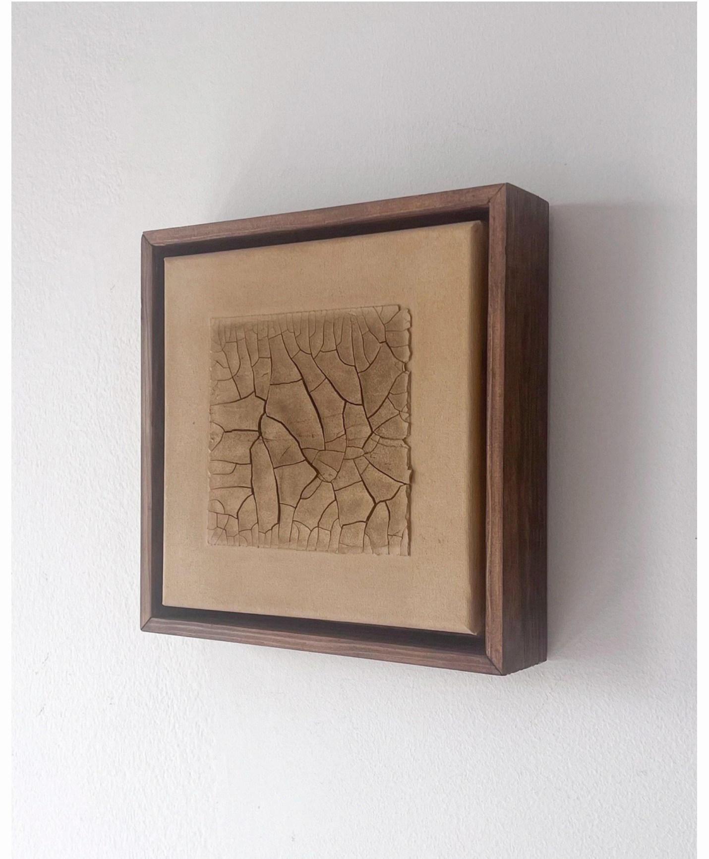
· Within every crack · 2025, Natural Pigments and mediums on canvas · Handmade wooden frame 20 x 20 cm Available