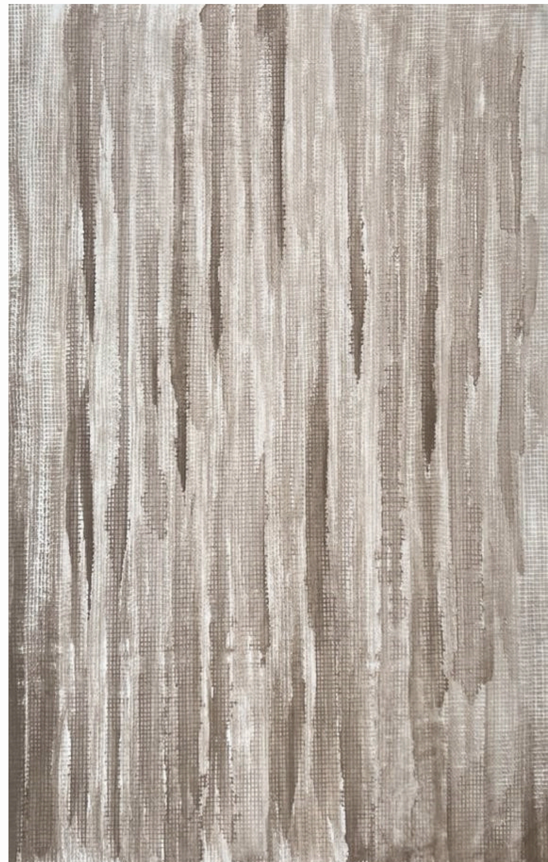
· Untitled I · · Untitled II · 2025, Natural Pigments on washi papper 99 x 67 cm Available